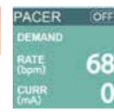
Modulo ECG Module ECG